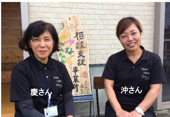
相談支援事業所つなぐ (瀬戸内町勝能)