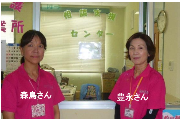
相談支援センター加計呂麻園 (瀬戸内町伊子茂)

「お問い合わせ先」 奄美地区障がい者等基幹相談支援センター(ぴあリンク奄美) 鹿児島県奄美市名瀬幸町15番3号 Tel0997-69-4061 Fax0997-69-4062 HP ( http://www.amami-jiritsu.org/ )